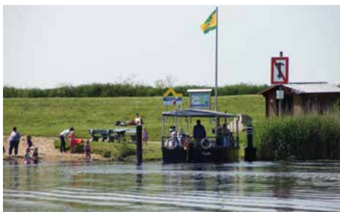
Ein vielseitiges Förderprogramm - Die Reduzierung des Schadstoffausstoßes der Bargener Fähre wurde 2021 gefördert