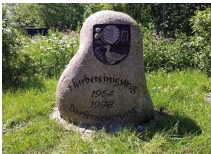
Der bei der Bushaltestelle Hohendiek aufgestellte Findling macht den Betrachter auf die einst erfolgte Flurbereinigung in Ellingstedt aufmerksam.